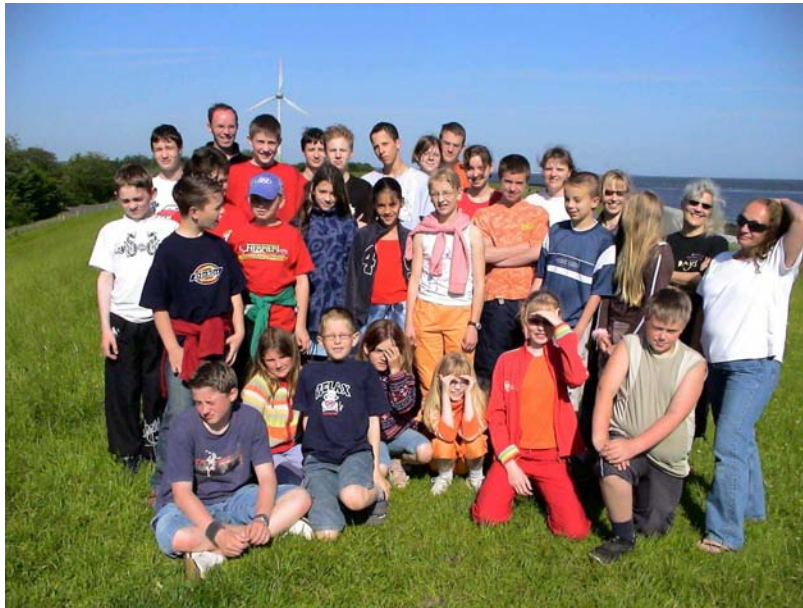
Die Isenbütteler und Wasbütteler Karatekids mit ihren Betreuern in Müggendorf

Doch nicht nur Sportliches gibt es im Freizeitcamp zu erleben. Das Lagerfeuer am ersten Abend erfreut sich großer Beliebtheit.