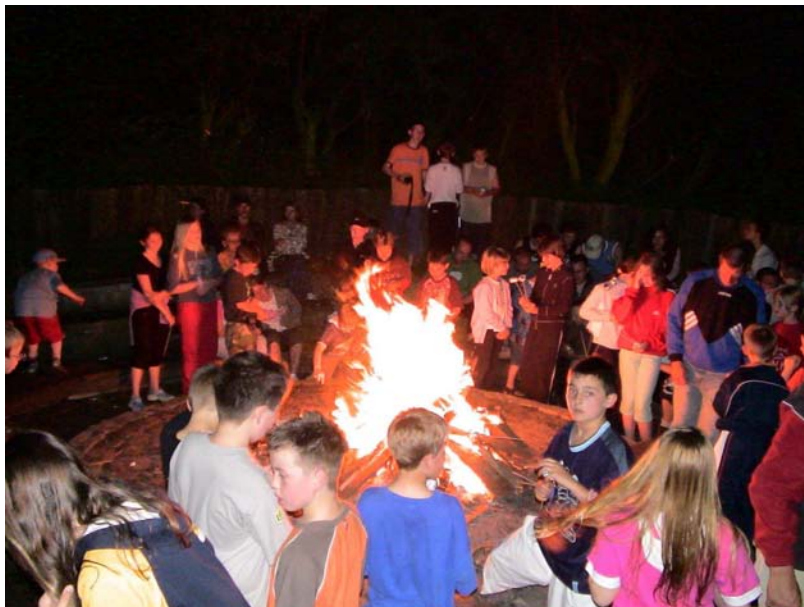
Am Lagerfeuer in Müggendorf

Doch nicht nur Sportliches gibt es im Freizeitcamp zu erleben. Das Lagerfeuer am ersten Abend erfreut sich großer Beliebtheit.