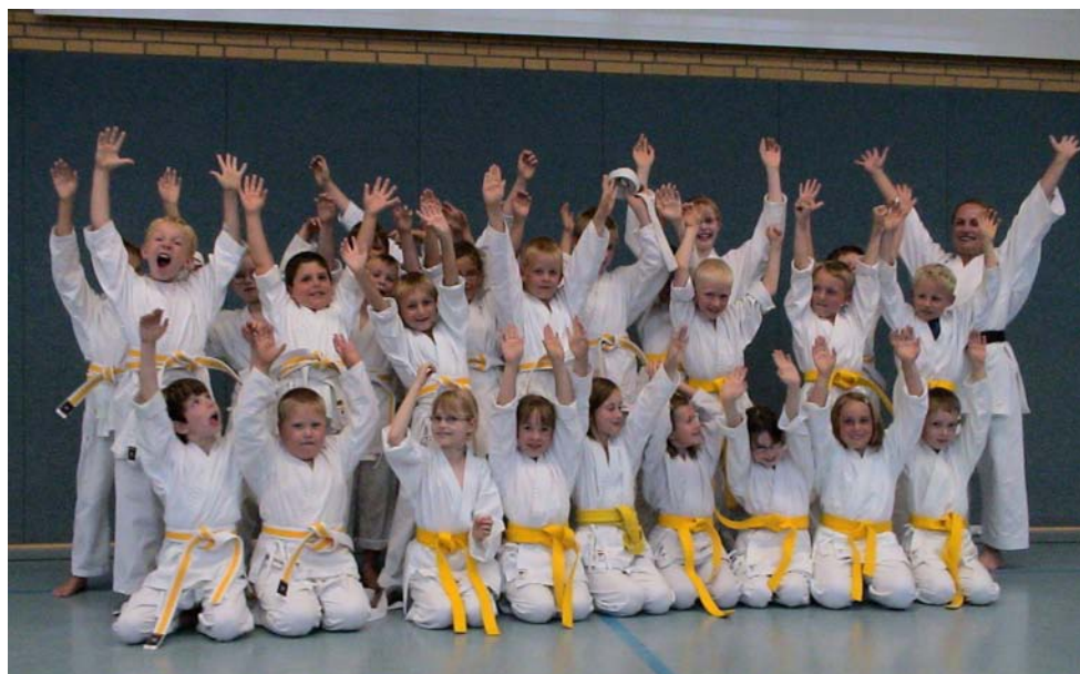
Fortgeschrittene Soundkaratekinder nach bestandener Prüfung