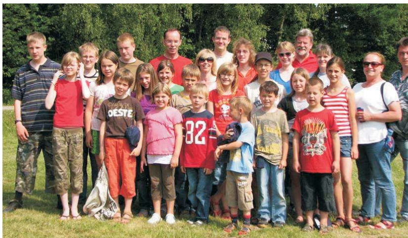
Teilnehmer des MTVI in Müggendorf

Den größten Anteil in unserem Dojo haben die Karatekinder. Neben den zahlreichen Trainingseinheiten für diese Altersgruppen, gab es auch in diesem Jahr wieder Angebote zum Besuch von Lehrgängen. Der Lehrgang in Müggendorf im Juni wird von uns traditionell mit einer starken Kindergruppe besucht.