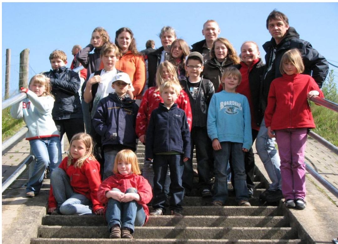
MTVI-Team in Müggendorf am Deich